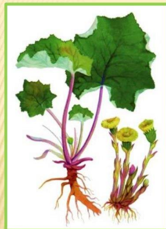
Мать – и – мачеха