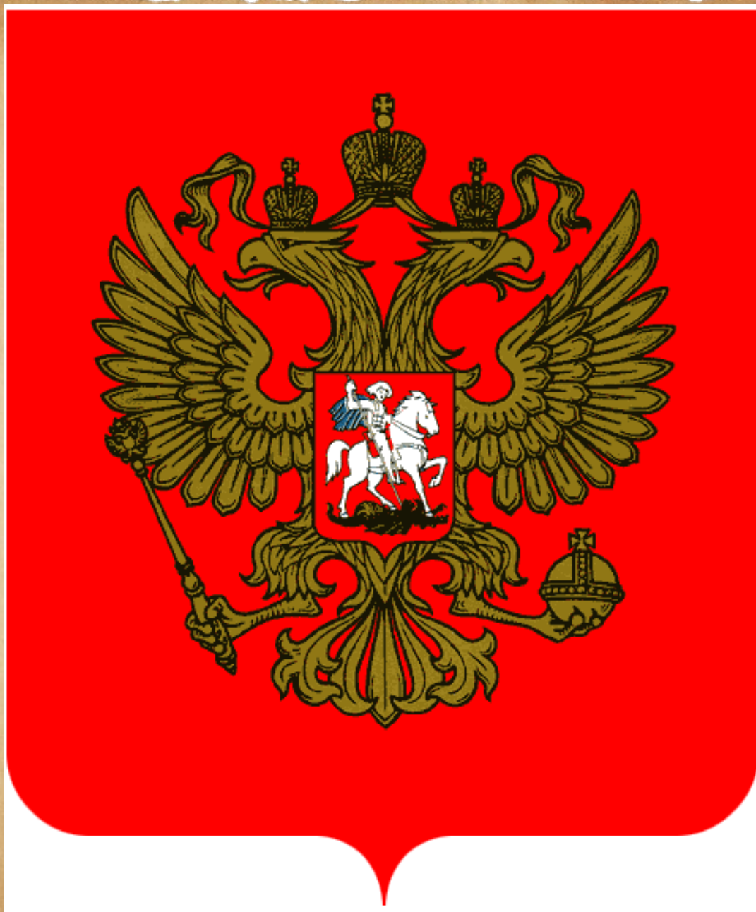
Государственный герб Российской Федерации