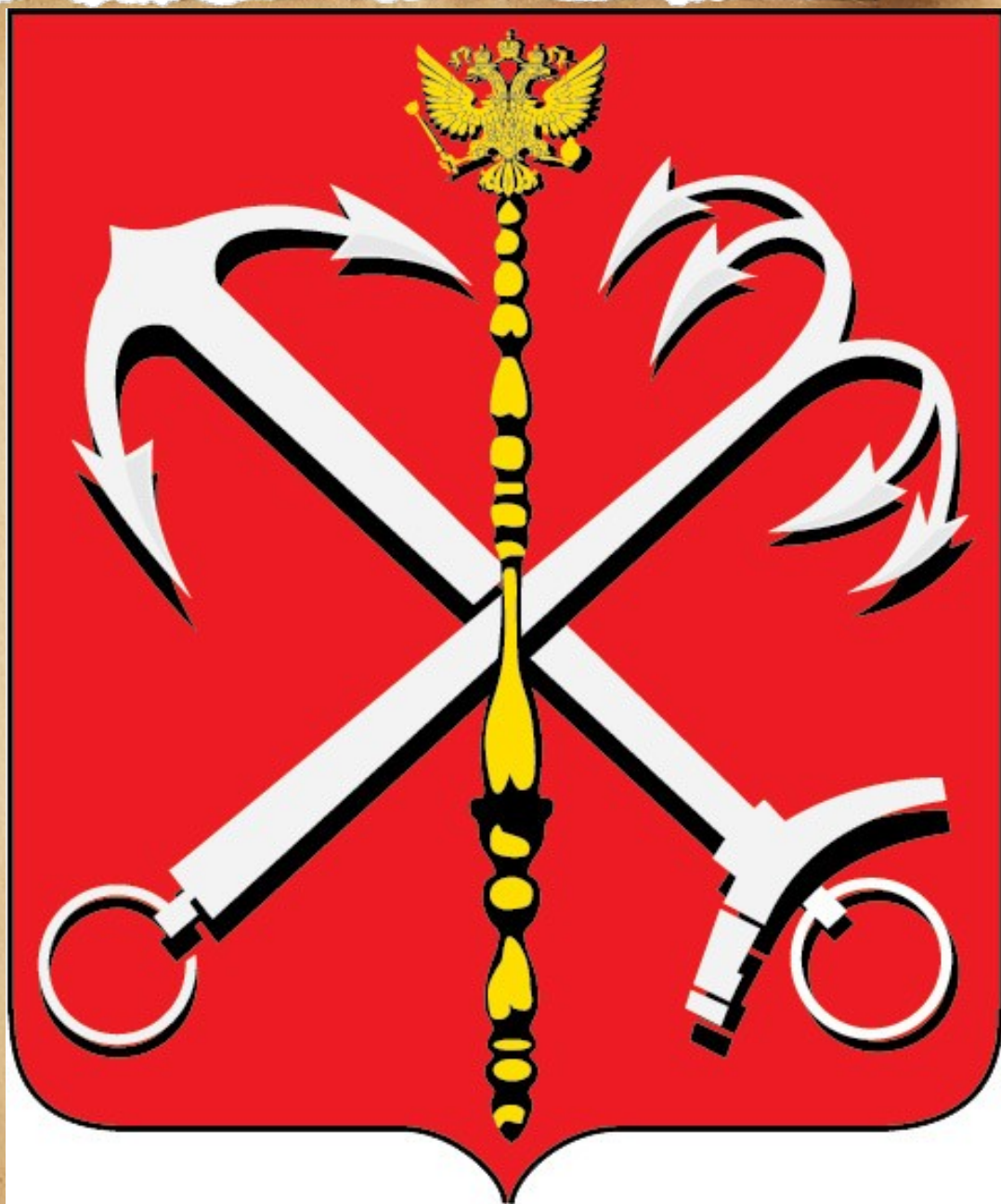
Малый герб Санкт-Петербурга

За скипетром перекрещиваются 2 якоря. Один из них морской – с двумя лапами. Другой – речной. У него 4 лапы. Он называется якорь- кошка. Якоря обычно рисуют золотыми или серебряными. Якоря говорят о том, что Санкт-Петербург – город морской и речной. Он стоит на берегах Невы и Балтийского моря.