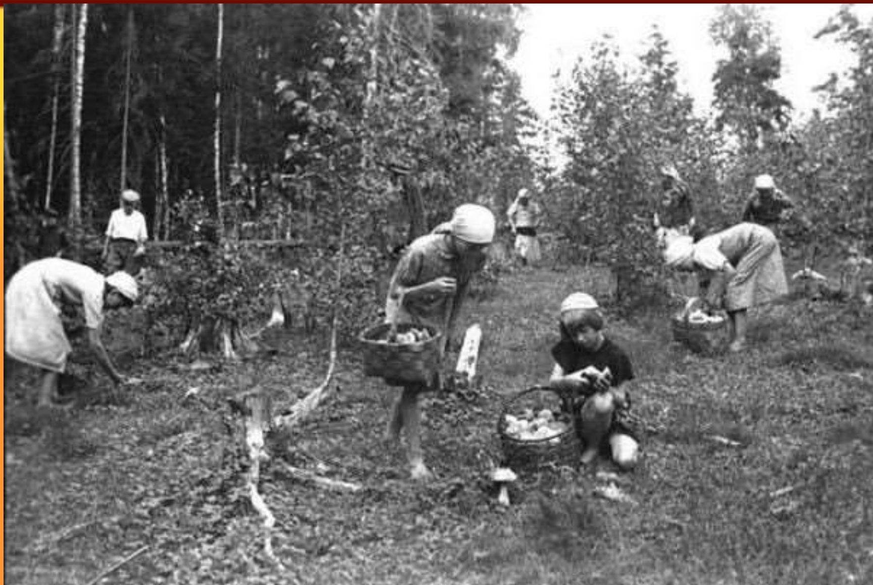
Собирали грибы и ягоды.