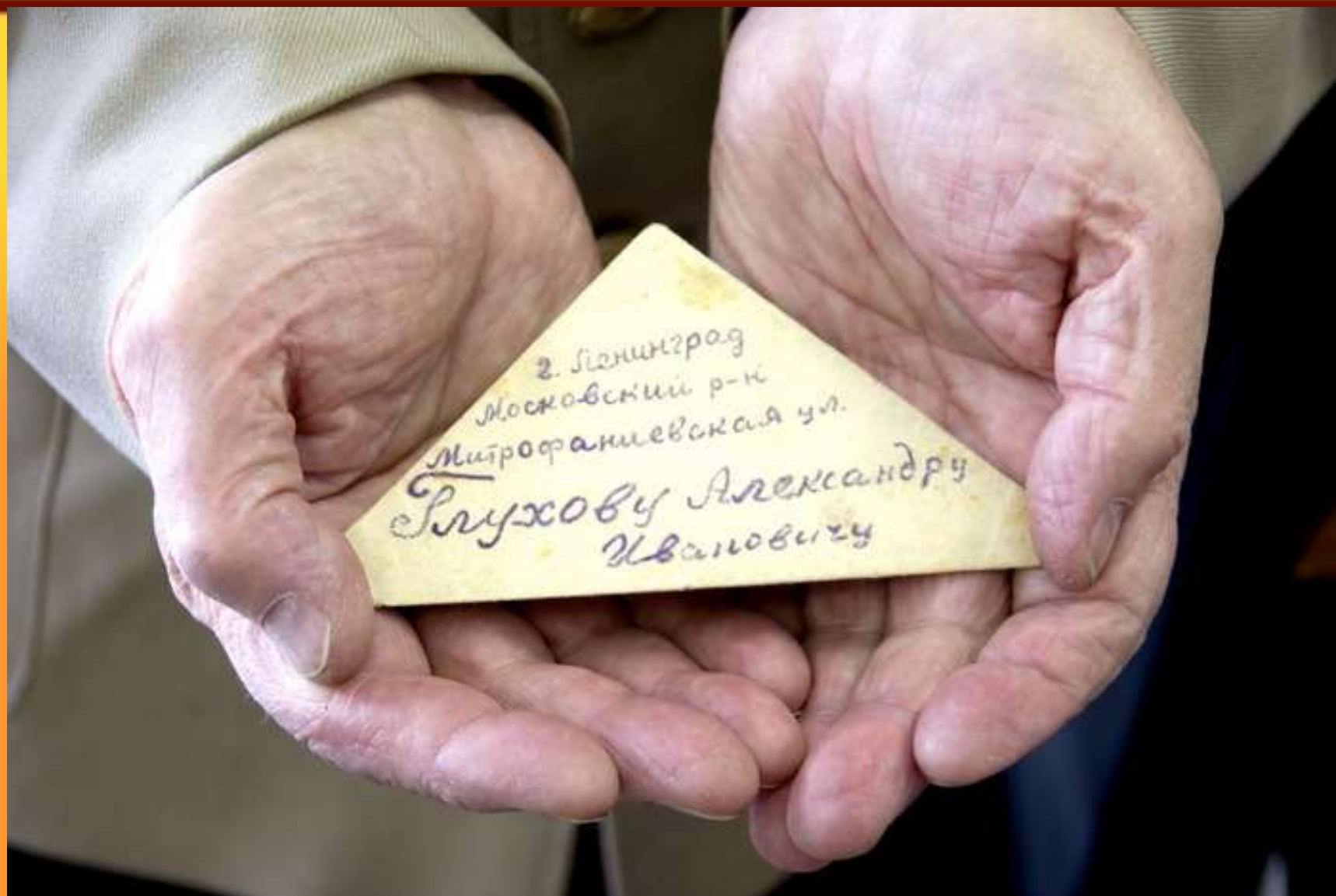
Вот такие солдатские треугольники приходили с фронта.